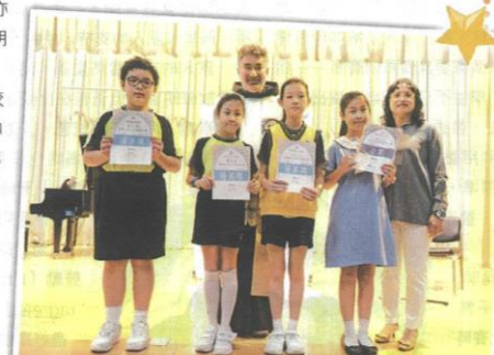
4. 四位同學參與玫瑰堂舉辦的兒童及青少年讀經比賽。